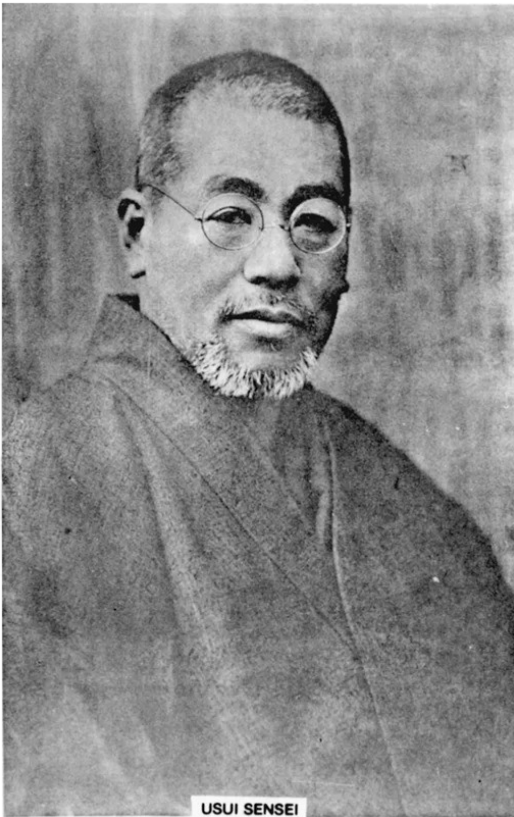
生先井白祖肇法療氣靈井白